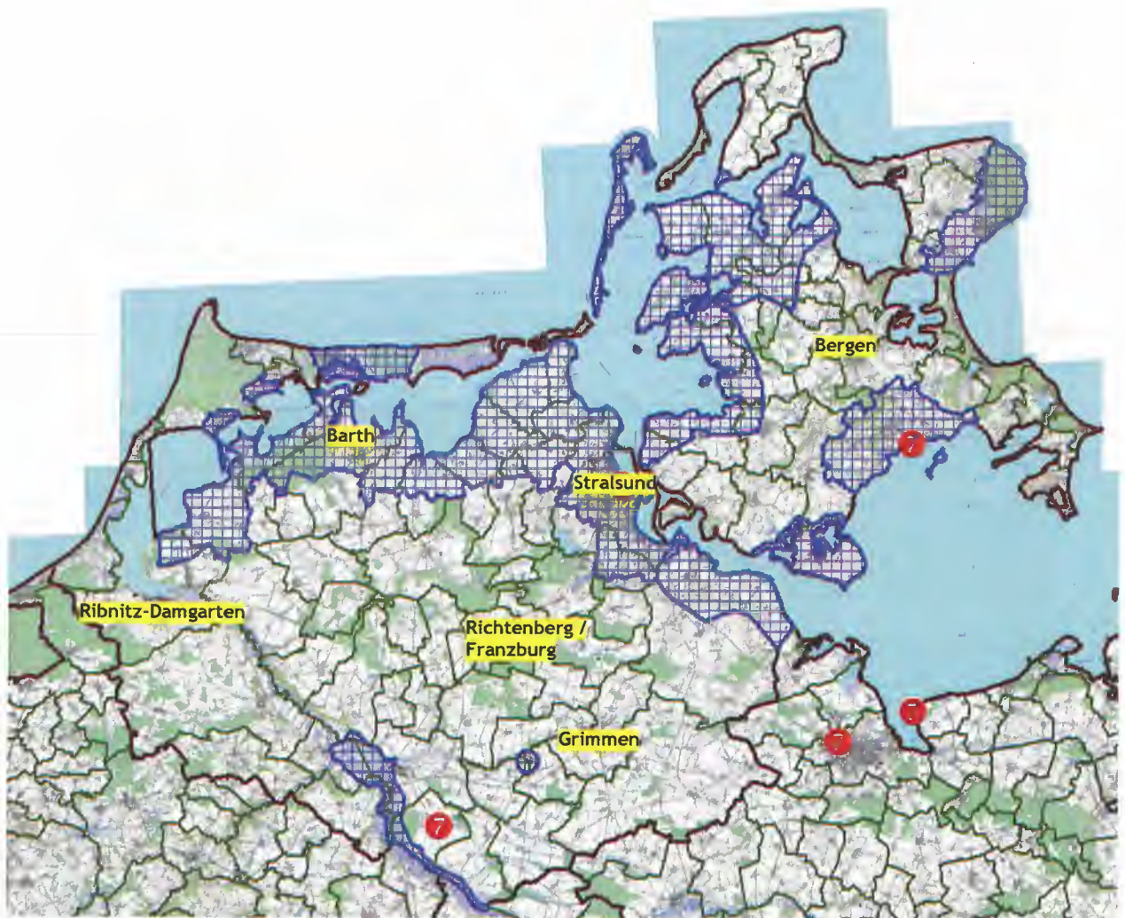
Übersicht zu den Risikogebieten